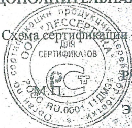
Схема сертификации – Зс по ГОСТ Р 53603-2009.